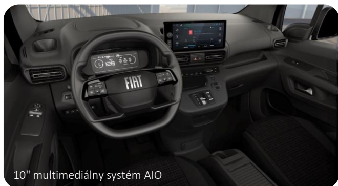
10" multimediálny systém AIO

10" multimediálny systém AIO: (štandard L1 | L2 Combi) SD dotykový displej bezdrôtové Apple CarPlay / Android Auto možnosť pripojiť 1 zariadenie 2x USB C, Bluetooth, DAB