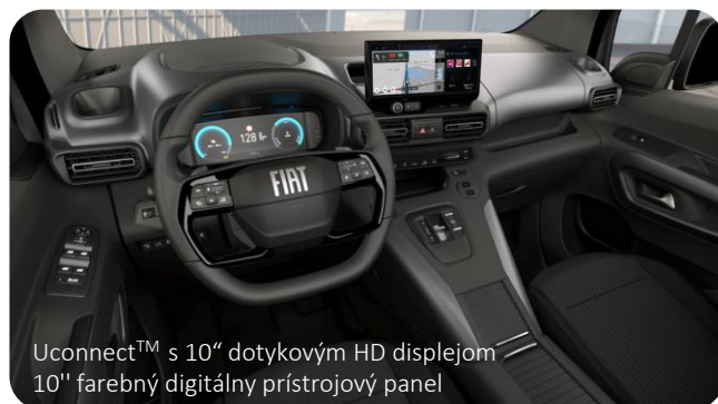
Uconnect™ s 10" dotykovým HD displejom 10" farebný digitálny prístrojový panel