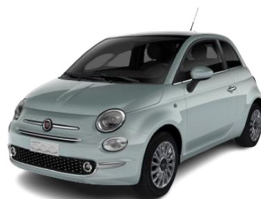
zelená metalíza Ruciada 490 €