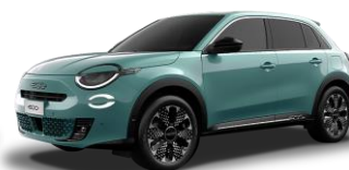
azúrová Cielo 959 | 5DN 600 €