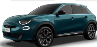
modrá Mare 688 | 52U 600 €