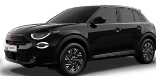
čierna 601 | 5DL 350 €