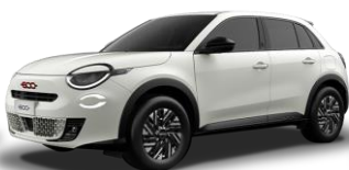
biela 268 | 5CA 350 €