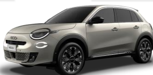
piesková Sabbia 636 | 3YS 600 €