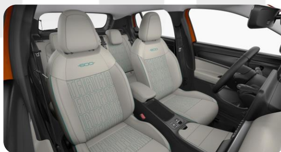
Obrázky sú ilustračné