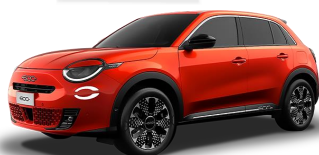
oranžová Sole 572 | 52T 0 €