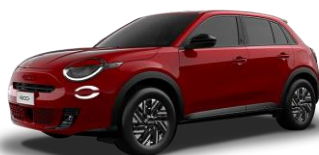
červená 111 | 5CB 350 €