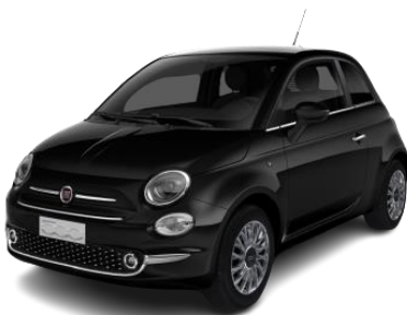
čierna metalíza Vesuvio 490 €