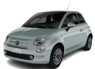
zelená metalíza Ruciada 490 €