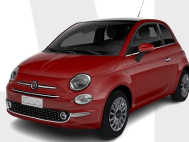
červená Passione 0 €

7" TFT displej prístrojového panela Uconnect™ rádio so 7" dotykovým displejom ovládanie na volante, Bluetooth, USB, AUX, DAB Apple Carplay / Android Auto 6 reproduktorov