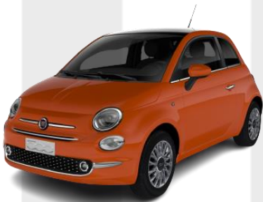
oranžová Sicilia 490 €