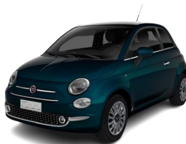
modrá metalíza Dipinto di blu 490 €