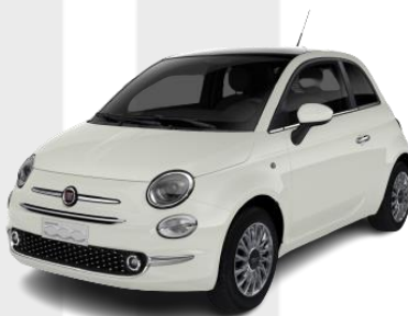
biela Gelato 490 €