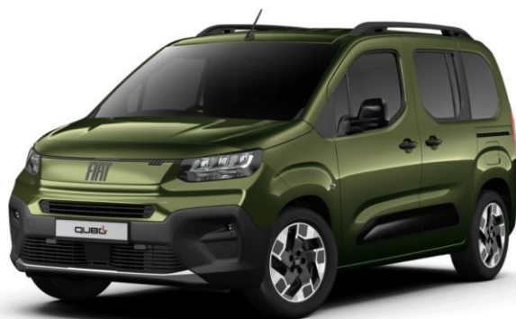
zelená metalíza FORESTA 550 | VJK