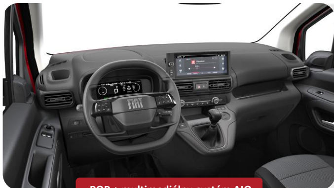
POP + multimediálny systém AIO