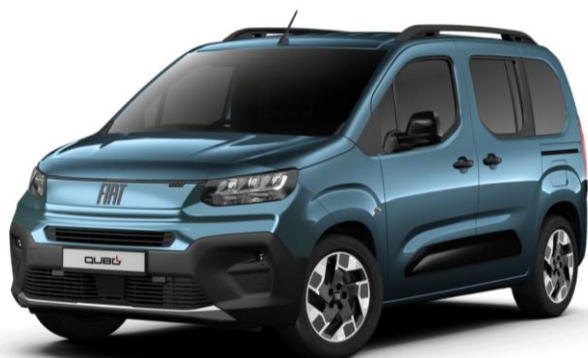
modrá metalíza RIVIERA 528 | 28C