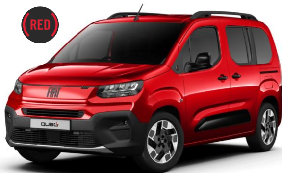
červená (RED) 182 | JJP (RED) plaketa VGN – viazaná opcia