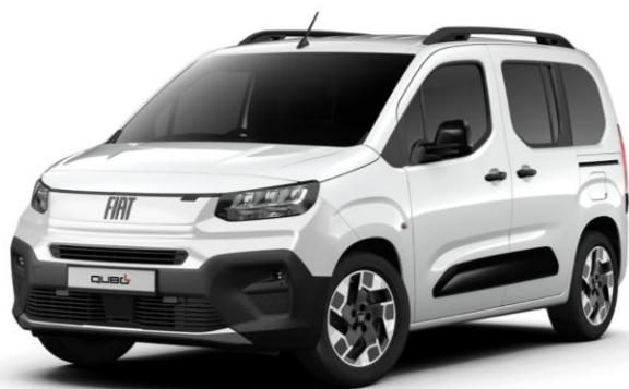
biela GELATO 549 | 5DL