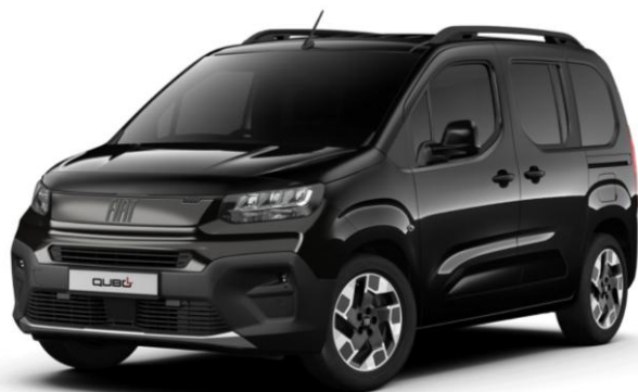
čierna metalíza CINEMA 632 | 5DP