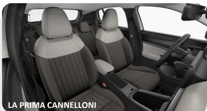
LA PRIMA CANNELLONI