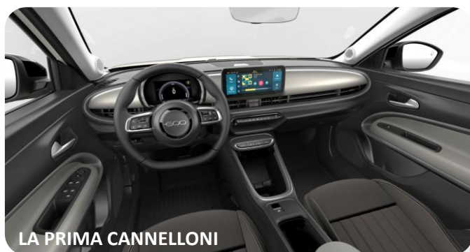
LA PRIMA CANNELLONI