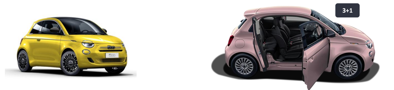
Plátená strecha - čierna