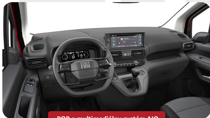
POP + multimediálny systém AIO

Služba aplikácie ochrany laku Waxoyl platí u participujúcich predajcov FIAT. Jej dostupnosť si overte priamo u autorizovaného predajcu FIAT.